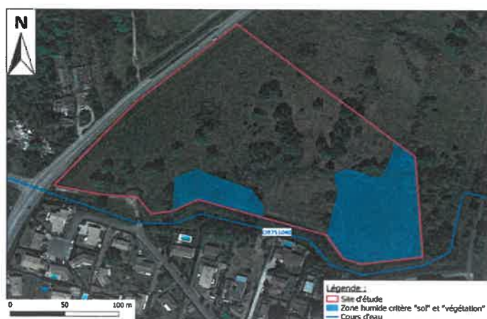
Figure 1: Zones humides dans le périmètre du projet – Carte extraite du complément d'éligibilité parcelle compensation

Malgré la mise en place de la séquence ERC (Eviter - Réduire – Compenser), des impacts résiduels persistent sur les zones humides avec un impact estimé à 4 047 m 2 . La zone humide impactée par le projet est donc au minimum de 4 047 m 2 composés d'une végétation de type friches herbacées et landes mésophiles.